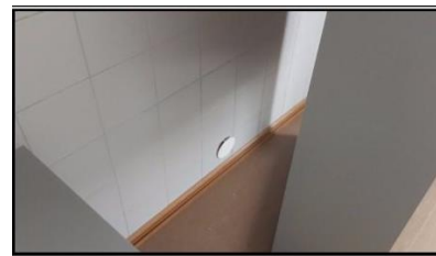
通称ネズミの穴 日中は食器棚があった。

また、リオオリンピックでのIOCは出場可否判断を各競技統括の国際連盟に委ねたことから、ロシア選手の出場可能とする道が開けたことから、クリーンな選手の出場の道が開かれました。